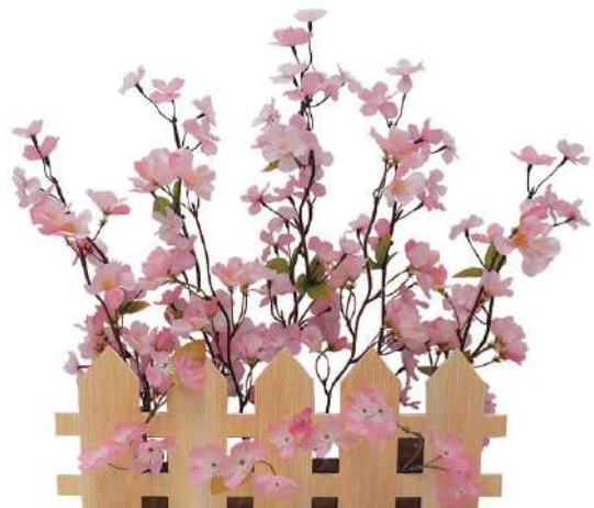
1 012161 桜垣根アレンジ H42×W57×D20cm 1コ ¥4,500 布・紙・スチロール・エスレン・スチール 出荷単位:1 片面