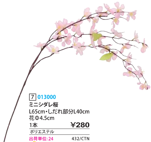
7 013000 ミニシダレ桜 L65cm・しだれ部分L40cm 花Φ4.5cm 1本 ¥280 ポリエステル 出荷単位:24 432/CTN