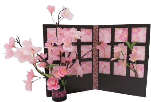
2 012016 桜障子アレンジ H25×W36cm 1コ ¥2,800 エスレン・ポリエステル・スチール 発泡スチロール・紙 出荷単位:1