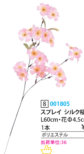
8 001805 スプレー シルク桜 L60cm・花Φ4.5cm 1本 ¥220 ポリエステル 出荷単位:36 36/720