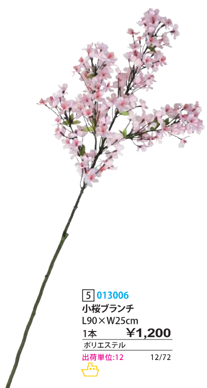
5 013006 小桜ブランチ L90×W25cm 1本 ¥1,200 ポリエステル 出荷単位:12 12/72