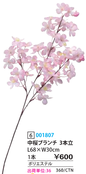
6 001807 中桜ブランチ 3本立 L68×W30cm 1本 ¥600 ポリエステル 出荷単位:36 360/CTN