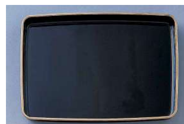
[7] 054552 プラスチック賞状盆 H4.5×W45×D31cm 1コ ¥9,800 プラスチック 出荷単位: 1