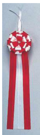
[2] 000039 テープカットリボン (大) L60cm・花Φ16cm 1コ ¥3,440 アセテート 出荷単位: (2) 両面 [3] 000040 テープカットリボン (中) L50cm・花Φ12cm 1コ ¥2,360 アセテート 出荷単位: (5) 両面 [4] 000041 テープカットリボン (小) L42cm・花Φ10cm 1コ ¥1,580 アセテート 出荷単位: (8) 両面