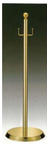
[9] 055901 テープカットボール (中) H90cm・ベースΦ30cm パイプ径Φ3.2cm・5.2kg 1本 ¥38,000 スチール製 出荷単位: 1 送料別商品