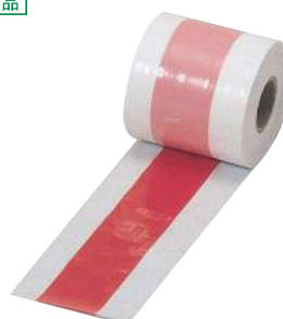
[16] 000625 ポリ紅白足巻80m巻 W75mm・厚さ0.05mm 1巻 ¥1,400 ポリエチレン 出荷単位: (5)