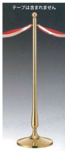
[8] 000933 テープカットボール (大) H110cm・ベースΦ30cm パイプ径Φ6cm・6kg 1本 ¥58,000 真鍮・スチール製 出荷単位: 1 送料別商品