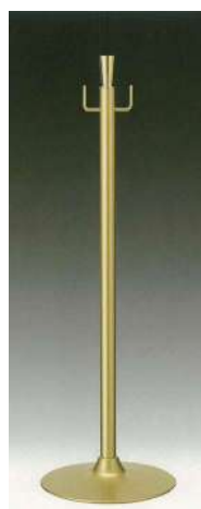
[10] 055900 テープカットボール (小) H80cm・ベースΦ28cm パイプ径Φ3.2cm・3.6kg 1本 ¥21,000 スチール製 出荷単位: 1 送料別商品