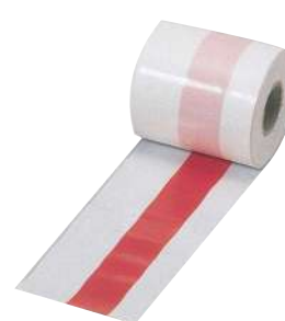
[17] 000640 厚手ポリ紅白足巻50m巻 W75mm・厚さ0.07mm 1巻 ¥1,300 ポリエチレン 出荷単位: 1