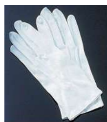
[6] 000672 手袋 フリーサイズ・ホック付 1双 ¥640 綿 出荷単位: (12) 480/CTN