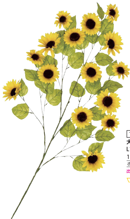
1 022558 大枝サンフラワー L110cm・花Φ8~10cm 1本 ¥2,400 ポリエステル 出荷単位:6 6/60