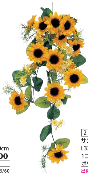
2 024253 サンフラワーバイン L33cm・花Φ5.5cm 1コ ¥780 ポリエステル 出荷単位:1 24/288