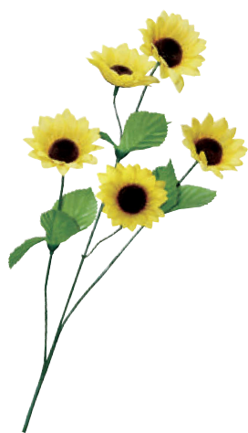
4 023002 ミニサンフラワースプレイ L55cm・花Φ6cm 1本 ¥200 ポリエステル 出荷単位:36 720/CTN