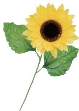
3 100004 サンフラワースプレイ(S) L50cm・花Φ13cm 1本 ¥280 ポリエステル 出荷単位:36 360/CTN