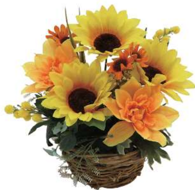
8 002218 ヒマワリ盛カゴアレンジ H21×W21cm 1コ ¥3,200 ポリエステル・スチロール・スチール 鉄・天然素材 出荷単位:1