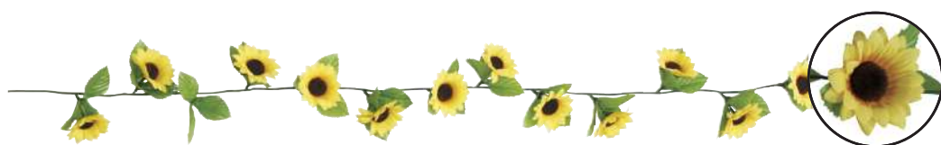
7 023003 ミニサンフラワーショートガーランド L120cm・花Φ6cm 1本 ¥480 ポリエステル 出荷単位:24 240/CTN