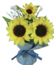
9 022604 ミニミニポットひまわり H15×W14×D12cm 花Φ4~7cm 1コ ¥380 ポリエステル・スチロール・不織布 出荷単位:24 288/CTN