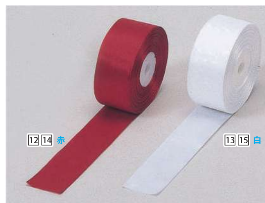
12 000982 赤 13 000981 白 1.5"リボンテープ W36mm・L29m 1巻 ¥1,300 レーヨン 出荷単位:5