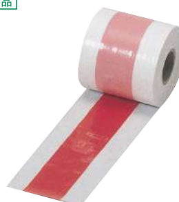
17 000625 ポリ紅白足巻80m巻 W75mm・厚さ0.05mm 1巻 ¥1,400 ポリエチレン 出荷単位:5