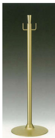
11 055900 テープカットボール(小) H80cm・ベースΦ28cm パイプ径Φ3.2cm・3.6kg 1本 ¥21,000 スチール製 出荷単位:1 送料別商品