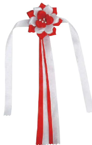
2 054450 ハサミ用リボン L23cm・花Φ5.5cm 1コ ¥710 レーヨン 出荷単位:24