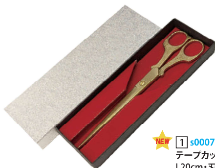
NEW 1 s000773 テープカットハサミゴールド L20cm・刃渡り10cm 1本 ¥4,800 スチール・金塗装 出荷単位:1