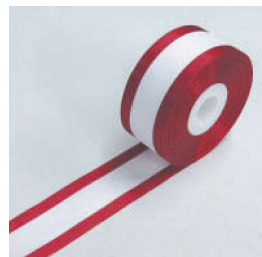
16 000980 1.5"赤耳リボン W36mm・L29m 1巻 ¥1,700 レーヨン・ナイロン 出荷単位:5