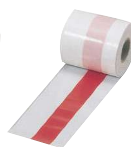
18 000640 厚手ポリ紅白足巻50m巻 W75mm・厚さ0.07mm 1巻 ¥1,500 ポリエチレン 出荷単位:1