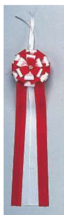
3 000039 テープカトリボン(大) L60cm・花Φ16cm 1コ ¥3,440 アセテート 出荷単位:2 両面 4 000040 テープカトリボン(中) L50cm・花Φ12cm 1コ ¥2,360 アセテート 出荷単位:5 両面 5 000041 テープカトリボン(小) L42cm・花Φ10cm 1コ ¥1,580 アセテート 出荷単位:8 両面