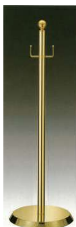
10 055901 テープカットボール(中) H90cm・ベースΦ30cm パイプ径Φ3.2cm・5.2kg 1本 ¥38,000 スチール製 出荷単位:1 送料別商品